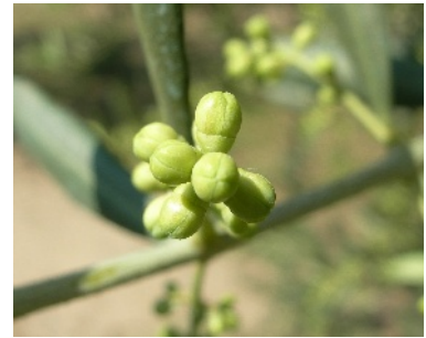
Différenciation des corolles

Tous les résultats de piégeage sur http://www.afidol.org/gestoliveprod/