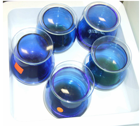
Dispositif officiel de dégustation

Possibilité de déjeuner dans un restaurant de la ville.