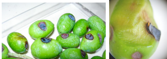
Aspect des olives avec les tâches noires dues au champignon (à gauche) Larve rosée de cécidomyie, au milieu du champignon (à droite)

La cécidomyie des olives limite le développement et l'augmentation des populations de mouches de l'olive. Le fruit n'est cependant pas sauvé puisque le champignon associé à cet insecte détruit complètement l'olive qui finit par tomber.