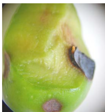
Larve rosée de cécidomyie, au milieu du champignon