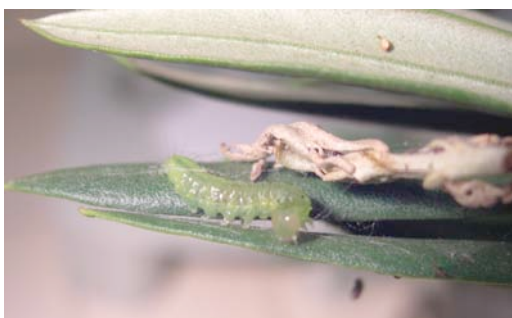
Dégâts et chenille de pyrale du jasmin sur oliviers.

Les observations contenues dans ce bulletin ont été réalisées par les partenaires suivants : Chambres d'agriculture des Alpes-Maritimes, Var, Vaucluse, CIVAM des Bouches-du-Rhône, CETA d'Aubagne, GRCETA de Basse-Durance, Groupement des oléiculteurs des Alpes-de-Haute-Provence, du Vaucluse, CIRAME.