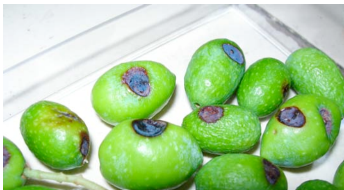
Aspect des olives avec les tâches noires dues au champignon

La cécidomyie des olives limite le développement et l'augmentation des populations de mouches de l'olive. Le fruit n'est cependant pas sauvé puisque le champignon associé à cet insecte détruit complètement l'olive qui finit par tomber.